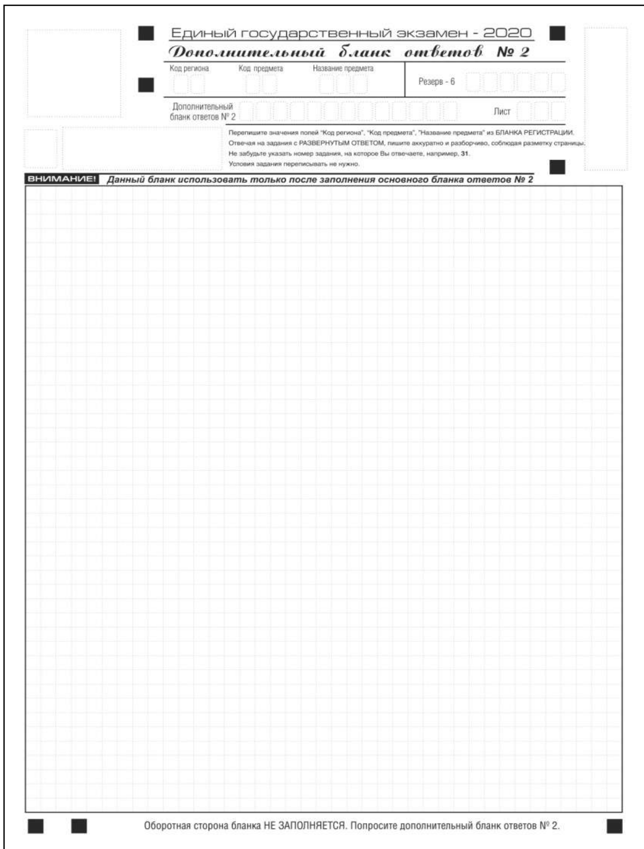
Рис. 15. Дополнительный бланк ответов № 2