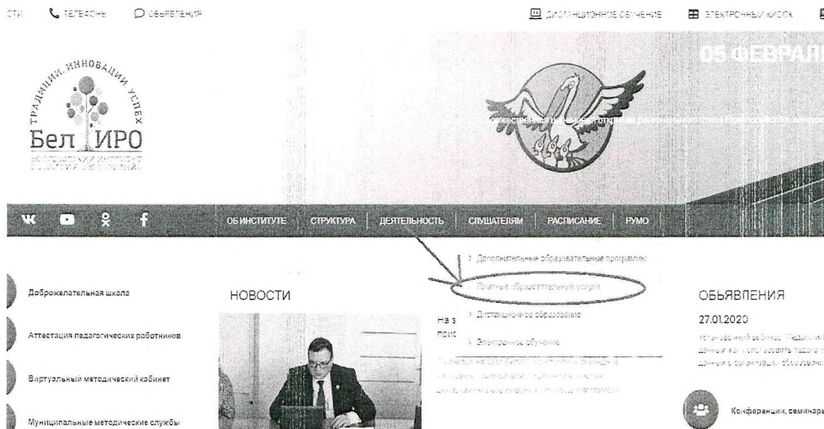
Рис.2 Раздел «Платные образовательные услуги»

2. Оплатить организационный взнос, используя услуги банка, онлайн версии услуг банка или мобильный телефон, указав следующую информацию: